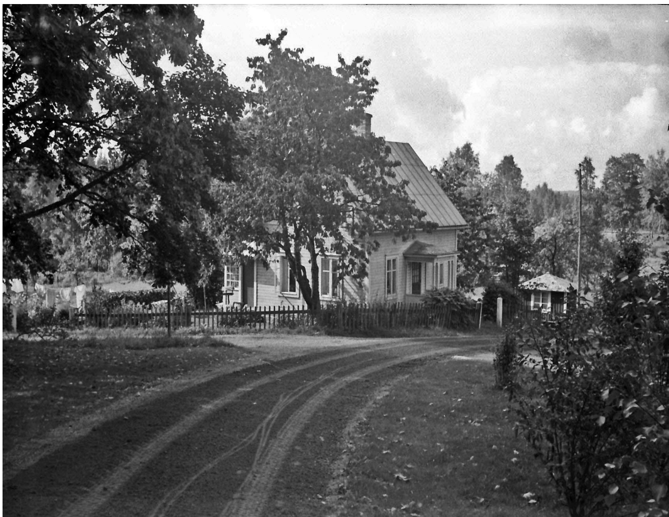
Brantåsa Lyckebo Foto 1963.